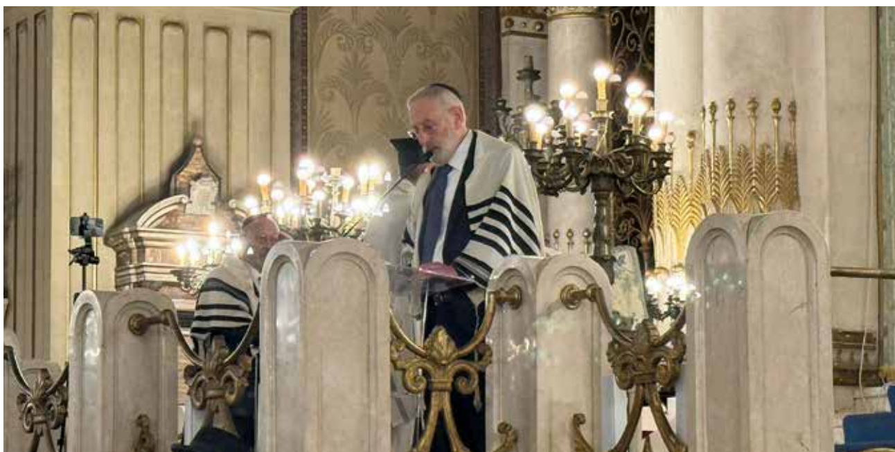
Yom HaShoah - Rav Riccardo Di Segni