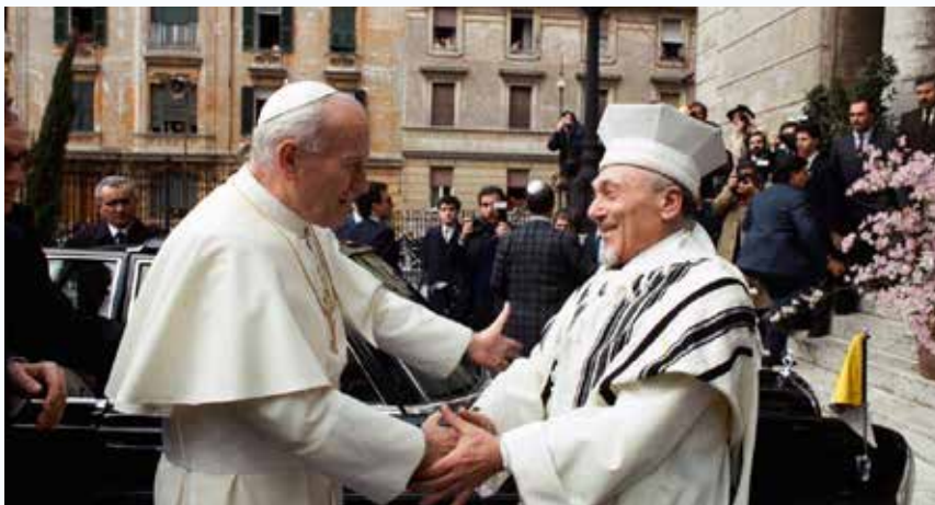
13 aprile 1986. Tempio Maggiore di Roma, lo storico abbraccio tra il Rabbino Capo Elio Toaff e Papa Giovanni Paolo II.