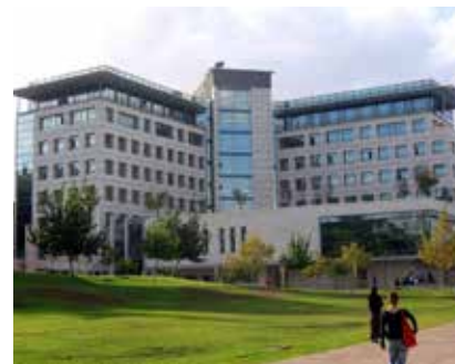
Fig. 2 Il Technion oggi. La Facoltà d'Informatica

Si colloca tra le prime quaranta università in ambito scientifico, con il Dipartimento di Ingegneria Elettronica tra i quindici migliori globalmente. Ha formato generazioni che hanno trasformato Israele nella "Start-up Nation":