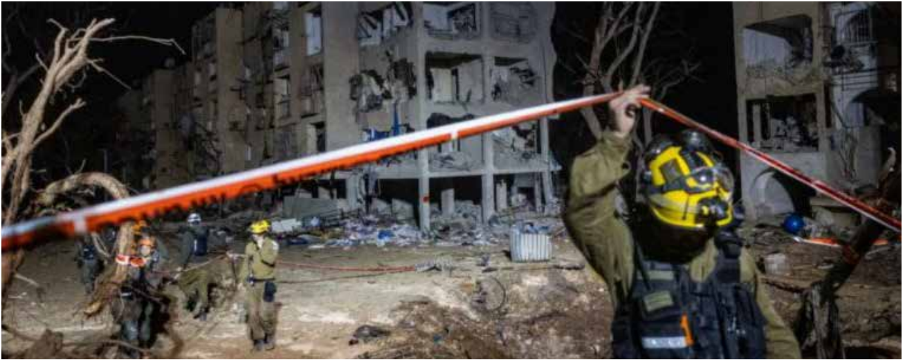
L'area residenziale di Dimona colpita lo scorso marzo dai missili iraniani

Le voci degli italkim sulle settimane di guerra