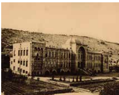
Fig. 1 Il Technion negli anni Venti del Novecento.