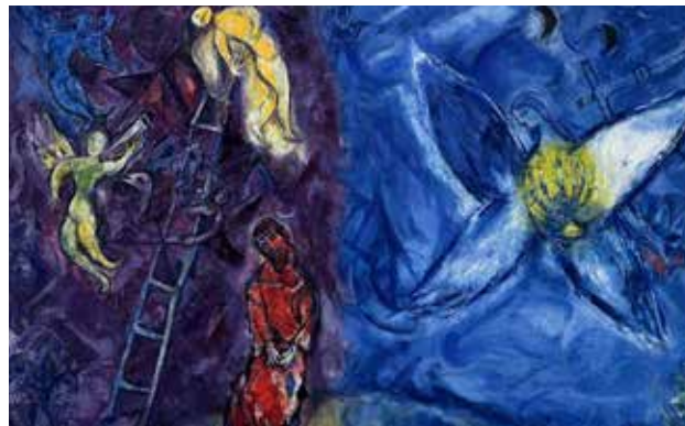
Marc Chagall, Il sogno di Giacobbe

“Chagall politico, il grido di libertà” è il titolo della spettacolare mostra itinerante allestita al Museo Chagall di Nizza, coprodotta dallo stesso Musée national Marc Chagall con il Museo La Piscine, Musée d'art e d'industrie André Diligent di Rubaix e con la Fundación MAPFRE di Madrid, visitabile fino al 16 settembre. Nel corso della sua vita, segnata da