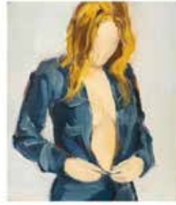
ESHKOL NEVO LEGAMI