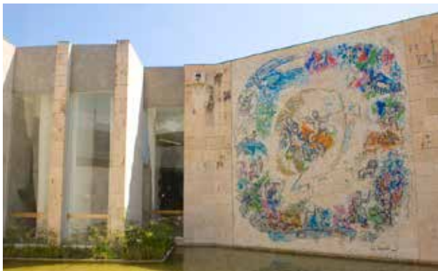
Il Museo Chagall di Nizza