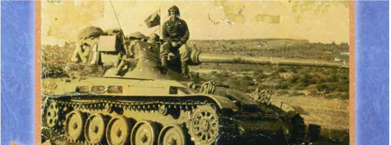
Giuseppe Sonnino Papone

Storie dall'Archivio della Comunità Ebraica di Roma