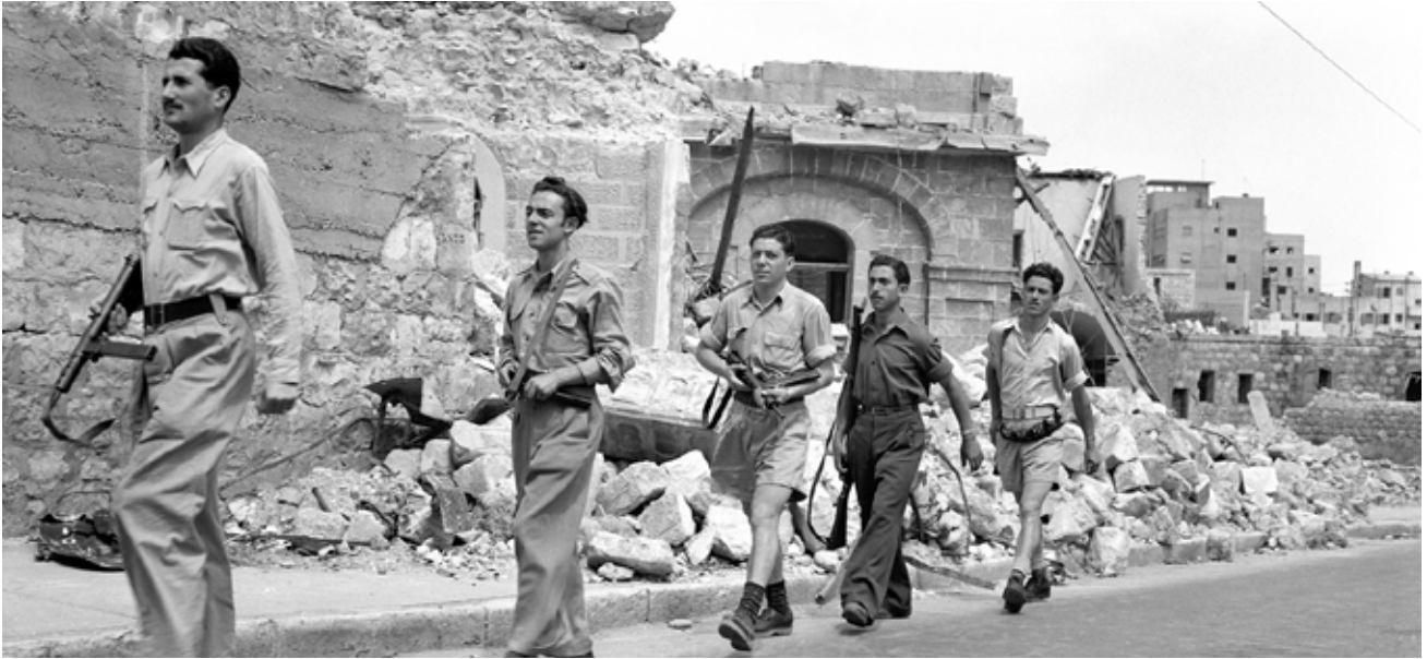
Truppe dell'Haganah a Haifa nel 1948

Il terrorismo arabo contro la popolazione ebraica di Israele non è nato naturalmente il 7 ottobre 2023 e neppure con le due "intifade", con la liberazione di Giudea e Samaria del 1967 o con l'indipendenza del 1948. L'inizio della violenza sistematica risale agli anni Venti del Novecento, quando bande arabe cercavano di depredare e distruggere i primi insediamenti ebraici. A quel momento risale il primo embrione dell'autodifesa di Israele: un movimento che si chiamava HaShomer (il guardiano) e addestrava all'uno di armi personali qualche membro per ognuno dei kibbutz e degli altri insediamenti. Lo guidava il primo eroe di guerra di Israele, ancora oggi ricordato con partecipazione: Iosif Trumpeldor ufficiale formato in Russia, immigrato nel 1912, caduto nel 1920 nella difesa dell'insediamento di Tel Hal, in Galilea settentrionale.