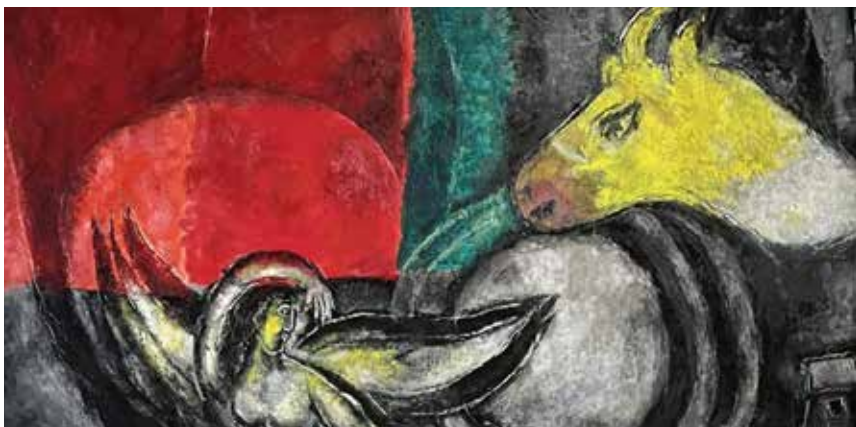
Marc Chagall, Pasqua

incontrate e dalle esperienze vissute, ed è emblematica di un impegno incrollabile per l'essere umano e dei suoi diritti, per l'uguaglianza e la tolleranza. Ispirate ad un forte anelito di libertà, le opere esposte sono incentrate sulle guerre che Chagall ha vissuto da testimone e sulle battaglie artistiche che ha intrapreso, trascendendo dalla forza poetica e dall'immaginazione, unite al vocabolario pittorico della derisione e dell'umorismo radicato nella cultura ebraica. Sostenuta da recenti ricerche su un cospicuo numero di documenti inediti provenienti dall'archivio dell'artista, la mostra propone un percorso cronobiografico presentato da una nuova angolazione dell'impegno politico di Chagall, riunendo numerosi capolavori che meritano di essere scoperti. Notevoli sono i prestiti francesi e internazionali tra cui, degno di nota, è il dipinto intitolato “Purim”: realizzato tra il 1916 e il 1917, è un prestito eccezionale del Philadelphia Museum of Art, fu esposto in Germania dai nazisti nel 1937 come esempio di arte degenerata. “Rabbi in Black and White or Jewat Prayer” del 1923 è un altro prestito significativo, proveniente dall'Art Institute di Chicago, mentre “Solitude” del 1933 giunge dalle collezioni del Museo d'Arte di Tel Aviv. Matita e pennello sono armi di pace per il grande pittore, disegni e dipinti rivelano così il suo idealismo incondizionato, la sua fede incrollabile nell'armonia tra uomini, creando visioni incrociate e dialoghi sulla storia in divenire.