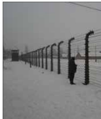
Il campo di sterminio di Auschwitz Birkenau oggi

guerra non era terminata). Ma anche in questo, Auschwitz non rappresentò un unicum, perché anche gli Alleati occidentali seguirono lo stesso obiettivo, inscenando incontri festosi tra i prigionieri e i soldati liberatori e ripetendo il loro ingresso nel campo di Mauthausen in maniera più trionfale e accolto da una folla giubilante di liberati e di fotografi.