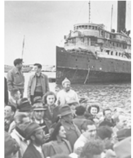
Immigrazione ebraica nel mandato britannico di Palestina

ta dall'opinione pubblica e le vittime costrette al silenzio. Il grande libro di Primo Levi, Se questo è un uomo , fu rifiutato nel 1947 e poi di nuovo negli anni successivi dalla casa editrice Einaudi (la lettera di rifiuto fu scritta da Natalia Ginzburg) e pubblicato in solo 2500 copie dalla piccola casa editrice torinese De Silva, diretta da Franco Antonicelli.