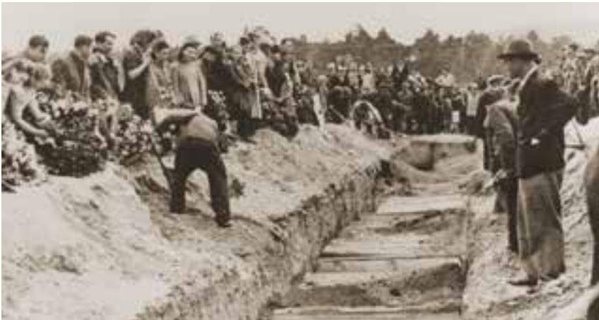
Il pogrom di Kielce

Anche per coloro che riuscirono a sottrarsi alle marce o poterono sopravvivervi, le difficoltà e le sciagure vere e proprie non erano affatto concluse. Al ritorno a casa si opponevano molti ostacoli, logistici, politici e burocratici, come racconta Primo Levi ne La tregua . Privi di documenti, di denari, dei mezzi minimi