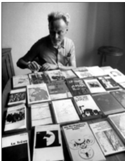
Primo Levi nel suo alloggio di Corso Re Umberto a Torino.

Nei primi giorni del gennaio 1945, sotto la spinta dell'Armata Rossa ormai vicina, i tedeschi avevano evacuato in tutta fretta il bacino minerario slesiano. Mentre altrove, in analoghe condizioni, non avevano esitato a distruggere col fuoco o con le armi i Lager insieme con i loro occupanti, nel distretto di Auschwitz agirono diversamente: ordini superiori, forse dettati personalmente da Hitler, imponevano di «recuperare», a qualunque costo, ogni uomo abile al lavoro; tutti i prigionieri sani furono evacuati, in condizioni spaventose, a Buchenwald e a Mauthausen, mentre i malati furono abbandonati a loro stessi.