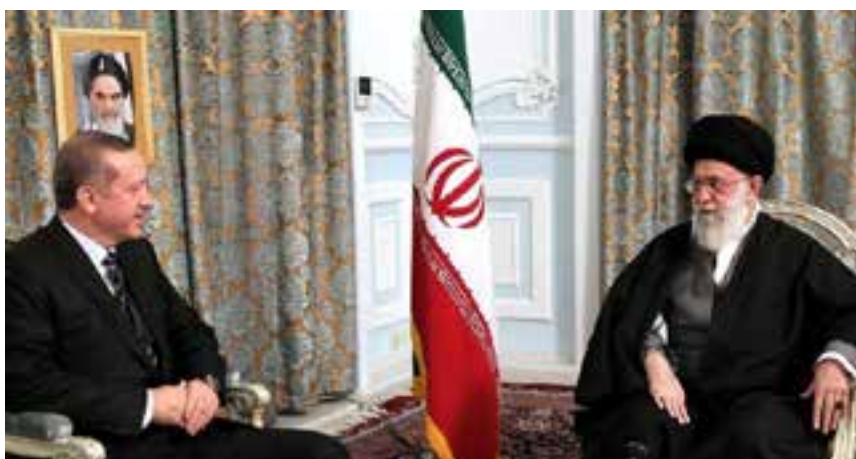
Il presidente turco Recep Tayyip Erdogan e la Guida Suprema dell'Iran Ali Khamenei

Nessuno può dire come la Siria sarà governata nei prossimi mesi: il Paese è troppo complesso etnicamente, religiosamente e geograficamente per consentire una previsione. Potrebbe diventare una costellazione di piccoli stati (uno sunnita, uno alawita, uno druso, uno curdo) oppure tornare a essere uno stato unitario governato con durezza da un dittatore, probabilmente l'attuale capo dei "ribelli", Al Golani. È chiaro comunque che la caduta della dinastia degli Assad, al potere da quarant'anni con l'appoggio della Russia e dell'Iran, è uno dei risultati più significativi della resistenza israeliana all'attacco del 7 ottobre 2023. Putin ha probabilmente perso le sue basi più importanti nel Mediterraneo e l'Iran ha visto cadere l'anello centrale della "catena di fuoco" che pensava di aver costruito contro Israele, perdendo anche il collegamento via terra con il Mediterraneo che gli permetteva di rifornire la sua milizia mercenaria più importante, Hezbollah.