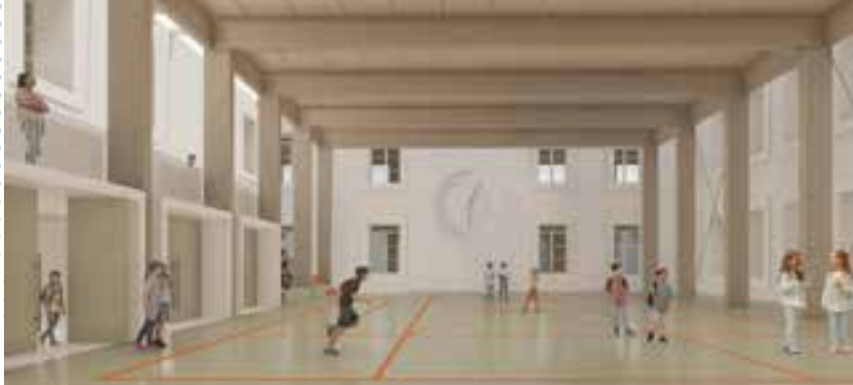
Render dei campi sportivi e dello spazio polivalente che verranno realizzati tramite la copertura del cortile di Palazzo della Cultura