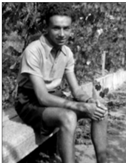
Primo Levi nella casa della famiglia materna (Fam. Luzzati), Piossasco, Torino, 1940.

L'avventura di Primo Levi non terminò con la liberazione di Auschwitz per mano russa. Per ragioni mai chiarite appieno, o forse per disordine burocratico, il rimpatrio di Primo Levi, e di molti altri italiani con lui, ebbe luogo molto alla fine del 1945, dopo un lungo viaggio attraverso la Polonia, la Russia Bianca, l'Ucraina, la Romania e l'Ungheria. Il volume è il diario del viaggio, che ha inizio nelle nebbie di Auschwitz, appena liberata e ancor piena di morte, e si dipana attraverso scenari inediti dell'Europa in tregua, uscita dall'incubo della guerra e dell'occupazione nazista, non ancora paralizzata dalle nuove angosce della guerra fredda: i mercati clandestini di Cracovia e di Katowice; gli acquartieramenti e le tradotte bibliche e zingaresche dell'Armata Rossa in smobilitazione; la terra russa ster-