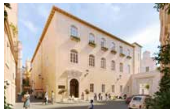
Il nuovo edificio del liceo Renzo Levi

Il sogno sta diventando realtà. Avremo per le nostre scuole edifici moderni, con infrastrutture sportive di livello agonistico e crescita dei nostri gruppi sportivi e delle organizzazioni giovanili. L'ultimo piano del Palazzo della Cultura diventerà agibile, gli spazi del sottotetto saranno resi disponibili per nuove funzioni. Parliamo di oltre 1500 metri quadrati totali in più, e spazi per le attività comunitarie legate alla scolastica, al Collegio Rabbinico, alle associazioni giovanili.