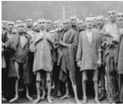
Una delle immagini della mostra "La fine del nazismo. La liberazione dei lager"

comprendere fino in fondo quanto accaduto. Non si aspettavano una situazione del genere. Alcuni, soprattutto tra i russi, svilupparono un istinto di vendetta. Ma c'era anche un altro aspetto: alcuni liberatori, disgustati dalla visione che si trovarono davanti, non mostrarono molta empatia con le vittime, ma piuttosto un senso di distacco. Si aspettavano un campo pieno di oppositori politici, mentre ciò che trovarono furono vittime designate per la loro presunta razza, per la maggior parte ebrei. Ciò non toglie il principio che i carnefici rimangono carnefici e i liberatori rimangono liberatori.