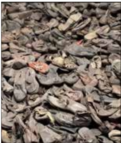
Le scarpe dei deportati esposte al Museo di Auschwitz

campo di Buchenwald, il 4 aprile, l'ultimo fu Mauthausen il 5 maggio), gli Alleati rimasero sconvolti dal numero impressionante di cadaveri ammucchiati ovunque, molti nudi, che interpretarono come la prova di uno sterminio di massa e fotografarono con particolare enfasi. Anche in questo caso, la storiografia impiegherà qualche decennio per spiegare come questa spaventosa ecatombe non fosse dovuta, se non in parte, alle uccisioni, ma alle conseguenze letali del disumano sovraffollamento dei Lager dopo le grandi evacuazioni di prigionieri di Auschwitz e dei campi situati a Est, pericolosamente vicini all'avanzata sovietica. Lo sterminio degli ebrei, di fatto, era avvenuto al di fuori del sistema concentrazionario, anche se non si può negare che molte vittime degli ultimi giorni dei Lager siano da computare tra le vittime della Shoah. Eppure, malgrado prove documentarie oggi inconfutabili, per l'opinione comune le immagini della Shoah sono quelle di Dachau e Bergen Belsen. A parlare più delle immagini di Auschwitz sono i corpi sfigurati dei morti e i volti inebetiti dei superstiti che non sembrano più esseri umani.